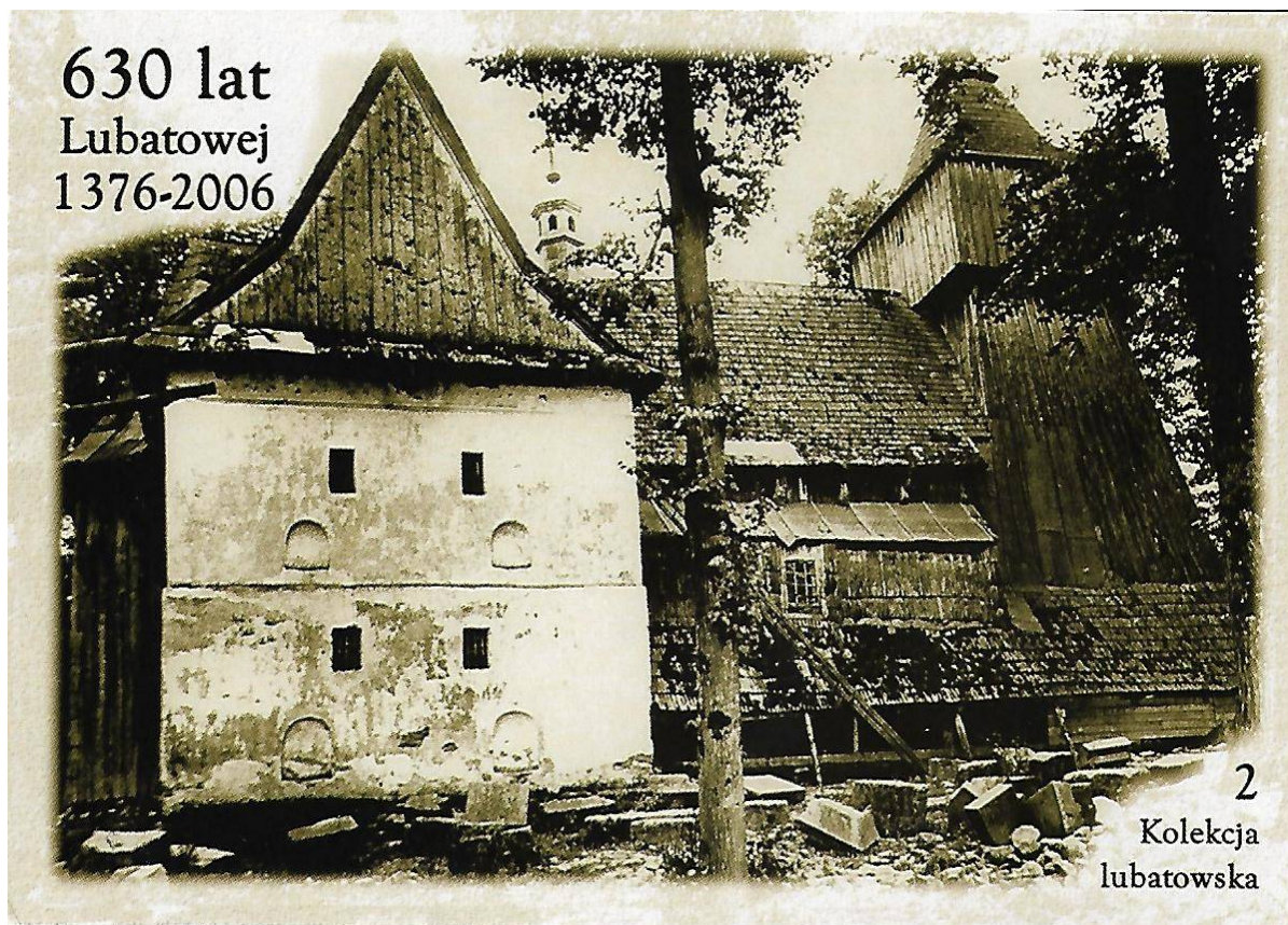
Stary kościół - ściana północna